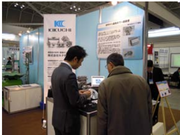
〔自社の技術を熱心に説明する共同出展企業の担当者〕